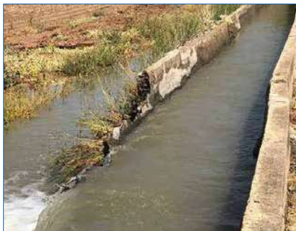
La falta de inversión en obras hidráulicas es cada vez más evidente.

El enfoque medioambientalista también gana la batalla en la cuestión de los caudales ecológicos. Se ha realizado una previsión completamente desproporcionada y desajustada a las características de nuestros ríos, que son ríos cortos mediterráneos con grandes crecidas cuando llueve y periodos de estiaje muy largos. Nada de esto se ha tenido en cuenta y la inclusión de estos caudales ecológicos desproporcionados y desajustados supone una amenaza latente a las concesiones que