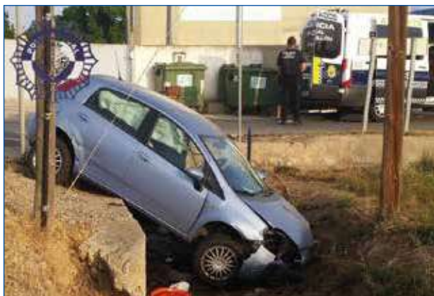
Coche accidentado en acequia.

No obstante, el TS en la sentencia de 09/10/2009 [R] 2009/7500] entiende que aun en el caso de resultar acreditado que las obras , con todos los elementos del sistema de