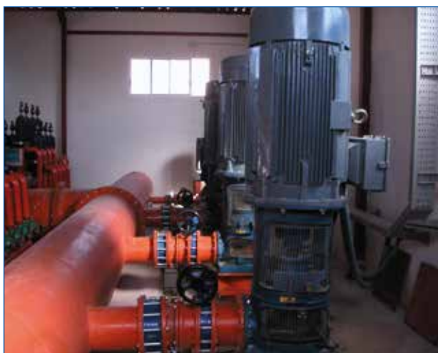
Estación de bombeo con bombas en paralelo

Entre las medidas a adoptar para mejorar la EEB, destacan el dimensionado de grupos de bombeo para caudales de funcionamiento habitualmente demandados,