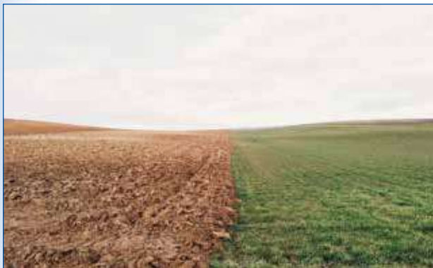
La agricultura es fundamental para frenar la desertificación.

El canon de vertidos establecido por el Reglamento del Dominio Público hidráulico tiene una función de cooperación medioambiental cuando premia, no sólo la depuración en correctas condiciones al dominio público hidráulico.