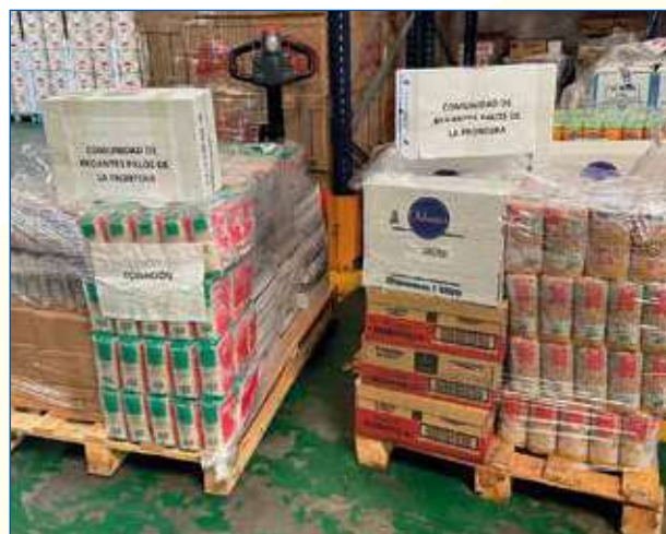
Palés con productos para el Banco de Alimentos de Huelva.

Pero si los regantes han batallado desde la primera línea, ahora también serán determinantes para la reconstrucción social y económica de España tras el coronavirus, dado