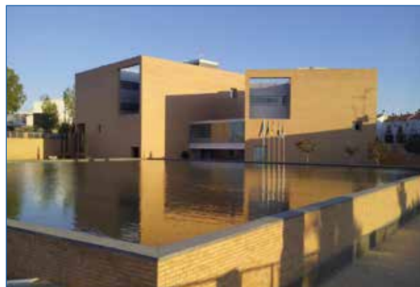
Sede de la Confederación Hidrográfica del Guadiana.

cos (responsabilidad objetiva), y siempre que dicho daño sea imputable a la actuación de la Administración Pública ( responsabilidad directa ), en este caso, Comunidades de Regantes.