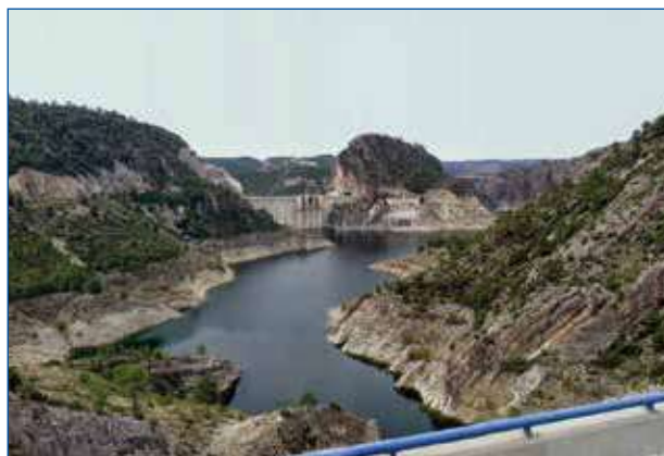
Embalse de Contreras.

En las alternativas de desalación y reutilización deben atemperarse los costes y reconocer como beneficiarios a los no usuarios directos que se aprovechan indirectamente. Y ello es porque con una actuación que