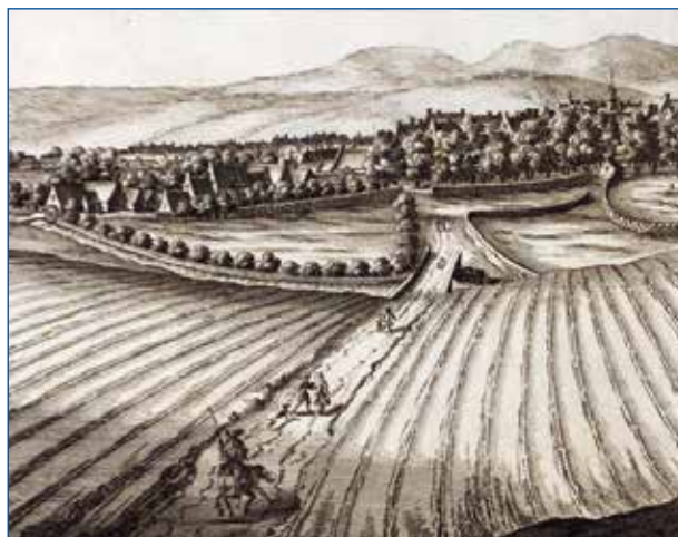
Antes de la revolución industrial la actividad agrícola era el principal motor económico.

A tal punto era importante y fundamental, que el gobierno del agua no se distinguía del gobierno en general, y