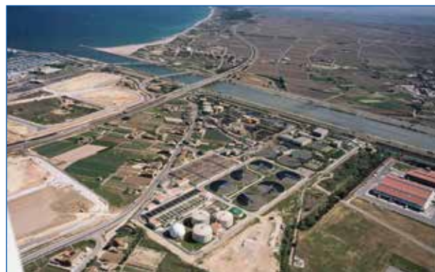
EDAR de Valencia (Pinedo I).