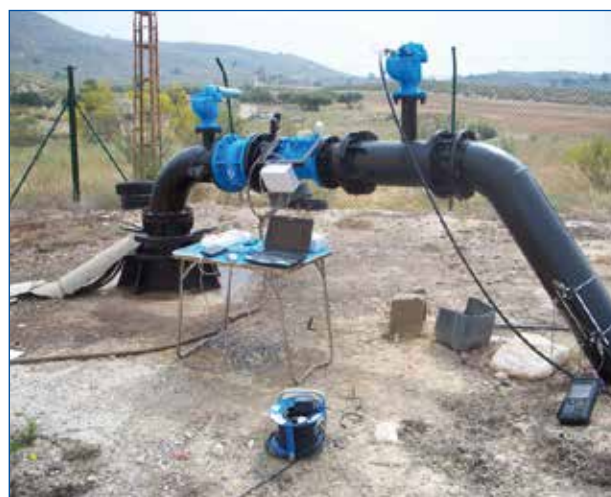
Tomada de datos de caudal y presión a la salida de un pozo

Una de las herramientas necesarias para poder cumplir este objetivo es la realización de auditorías energéticas de acuerdo con el Protocolo de Auditorías Energéticas en Comunidades de Regantes, publicado por el Instituto para la Diversificación y el Ahorro de Energía (IDAE) en el año 2008. Aunque el protocolo requiere una actualización que incluya la utilización de energías alternativas en las redes de distribución de riego, sigue estando en pleno vigor, ya que a día de hoy se exige como documento básico para acceder